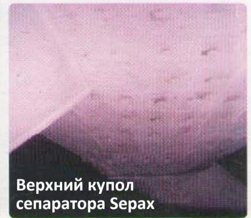
Верхний купол сепаратора Serax