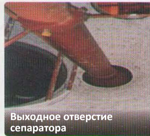
Выходное отверстие сепаратора