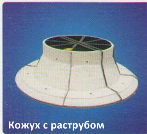
Кожух с растробом